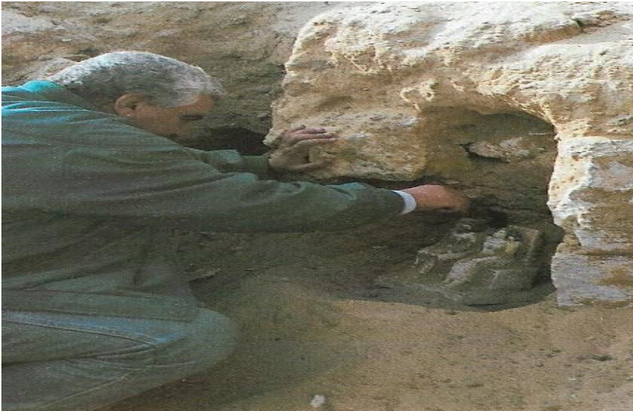
شكل رقم (3) مقبرة نفر - أف - منحوت - أس وزوجها نفر نيسوت إف بجبانة العمال