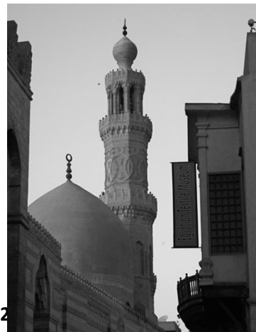
図3 図3 バルクークモスク

こうした略奪はイスラームの歴史遺産も無縁ではない。たとえば、バルクーク(Barquq)複合体のモスクでは(図3)、扉に取り付けられる金属製の幾何学装飾に、スルタン名が金で装飾されたものが盗難に遭っており、説教壇や扉装飾の損壊はイスラーム地区のその他施設でもみられている。キリスト教の建造物に関しては、治安組織の崩