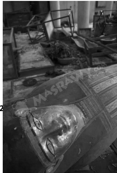
第3図 爆発されたマッラーウィー博物館

2013年8月は、ムルシー ( Mohamed Morsi ) 政権に対する軍事クーデターが起こり、イスラーム主義者たちが排除された混乱に乗じて、上エジプトのマッラーウィー ( Mallawi Museum ) 市にあった地方博物館が略