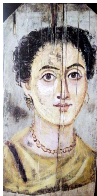
Doc. 2 : Portrait d'une femme ; MNC 1694 D'après : Musée du Louvre, Portraits de l'Égypte romaine , Paris, 1999, p. 90-91, fig. 47.