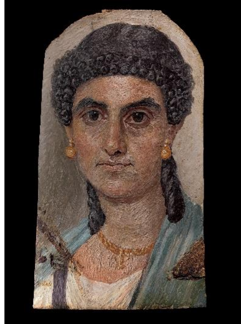
Doc. 4 : Portrait d'une femme ; 2013.438 D'après : https://www.metmuseum.org/art/collection/search/591557 , Le lundi 8 février 2021, 09 :12 AM.