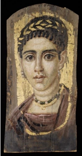
Doc. 3 : Portrait d'une jeune femme avec une couronne dorée ; 09.181.7 D'après : https://www.metmuseum.org/art/collection/search/547861 , Le lundi 8 février 2021, 08 :37 AM.