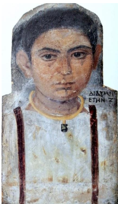
Doc. 1 : Portrait de Didymé ; E.5.1981 D'après : Musée du Louvre, Portraits de l'Égypte romaine , Paris, 1999, p. 56-57.